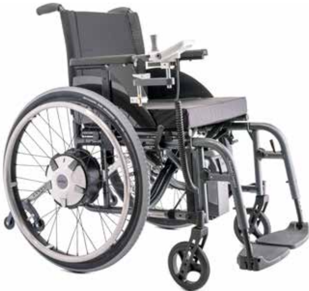
e-fix E36: kraftvolle Antriebsräder mit mehr Leistung (optional)

Mit den optional erhältlichen Antriebsrädern mit höherer Leistung kann der e-fix bis zu einem Personengewicht von 160 kg genutzt werden. Und wenn Sie mal nicht selbst fahren möchten, dann einfach die intuitive Begleitsteuerung einstecken und der e-fix wird zur Schiebe- und Bremshilfe für Ihre Begleitperson. Ein umfangreiches Zubehörprogramm bringt zusätzlich Erleichterung und Komfort ins Leben.