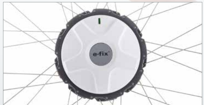
Kompakt, leise, kraftvoll: der e-fix Antrieb