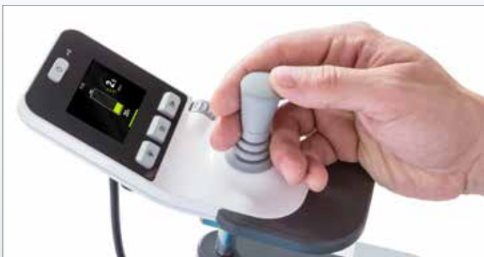
Aussagekräftiges Farbdisplay und benutzerfreundliche Bedienelemente