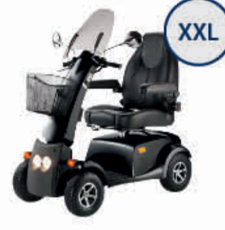
CITYLINER 415 XL 2.764 SEITE 5