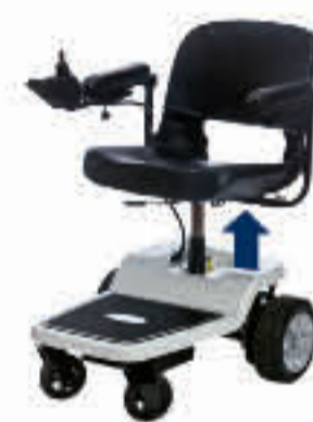
1.064UP SEITE 10