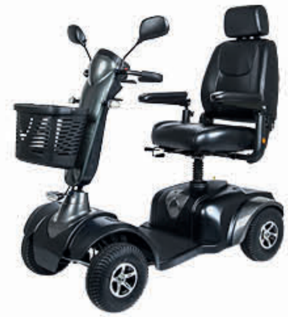
CL 510 1.264 SEITE 3