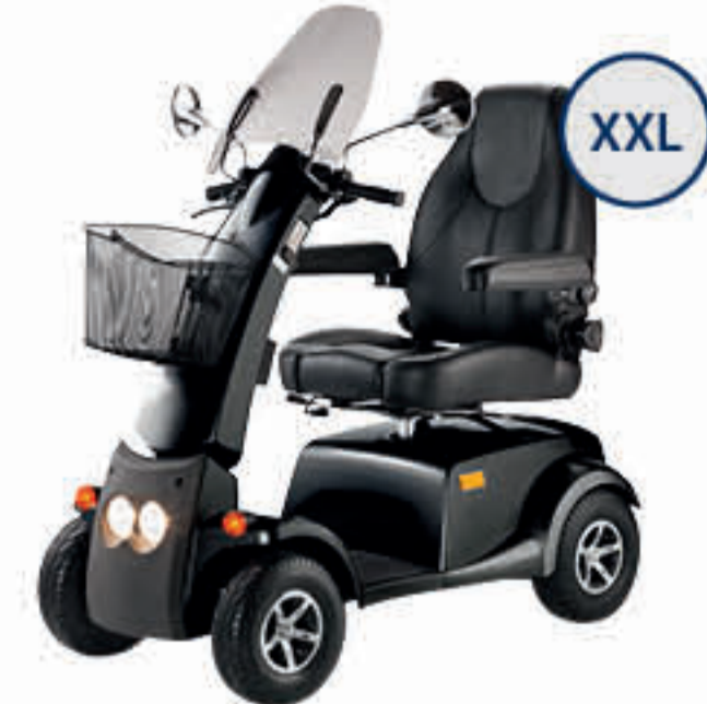
CITYLINER 415 XL 2.764 SEITE 5