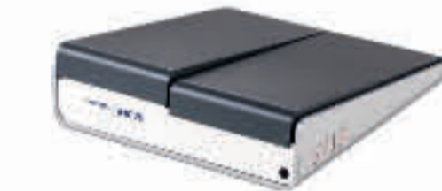
iMOVE SEITE 12