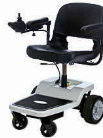
1.064 1.064UP SEITE 10