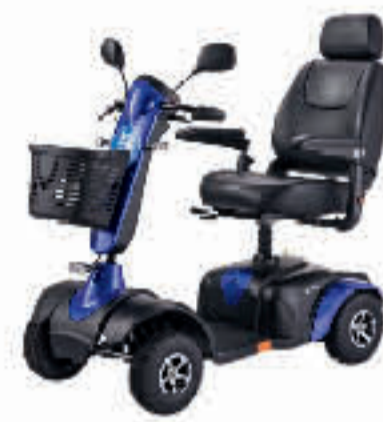
CL 409 1.254 SEITE 4