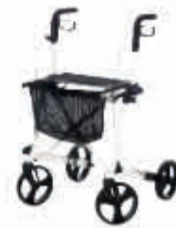
MOBILUS SEITE 7 Produktauslauf Mai 2021