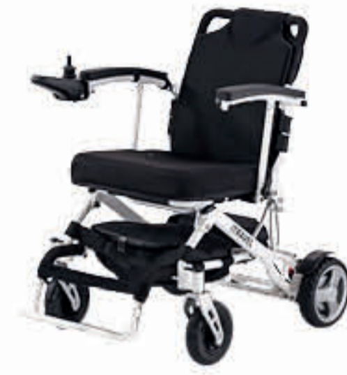
iTRAVEL 1.054 SEITE 6