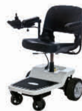
1.064 SEITE 10