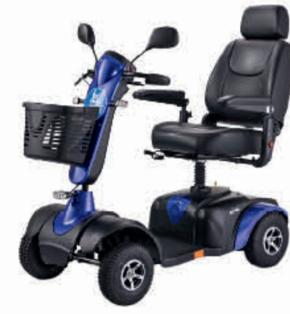
CL 409 1.254 SEITE 4