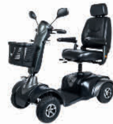
CL 510 1.264 SEITE 3