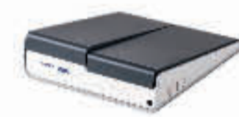
iMOVE SEITE 12