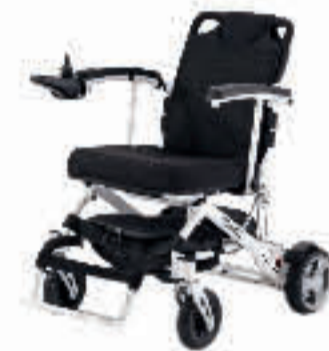
iTRAVEL 1.054 SEITE 6