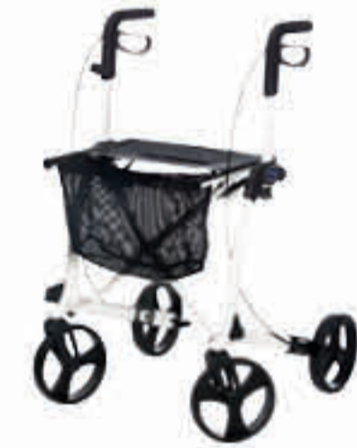
MOBILUS SEITE 7