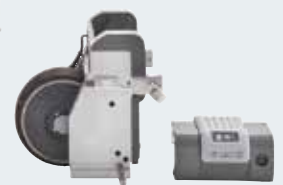
viamobil – klein, leicht, handlich und mühelos zu transportieren