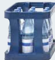
viamobil – klein, leicht, handlich und mühelos zu transportieren