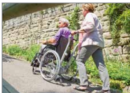
Steigungen ohne jede Anstrengung meistern.