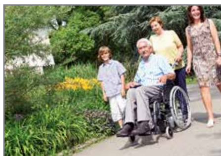
Komfortable Sicherheit auch bei Gefälle.

Wir sorgen für Mobilität. Egal in welcher Lage.