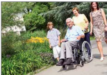
Komfortable Sicherheit auch bei Gefälle.