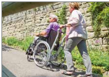
Steigungen ohne jede Anstrengung meistern.